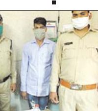
है। सूचना पर मुखबिर के बताये स्थान पर दबिश दी गई जहाँ मुखबिर के बताये हुलिये के अनुसार खड़ा युवक पुलिस को